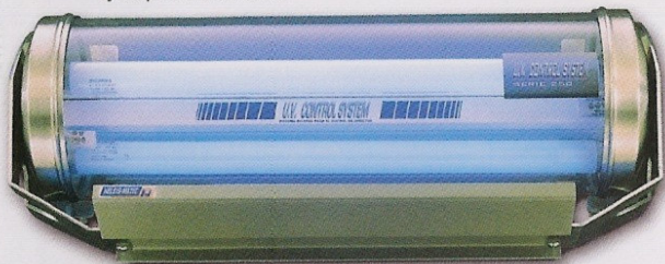
"Ejemplo mural 60w"